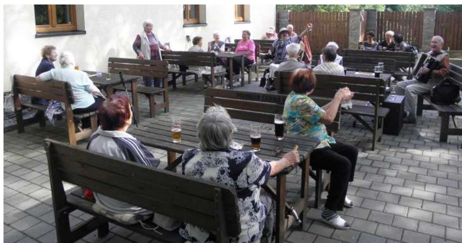
Fotografie z vycházky do Sherwoodu loni v září.