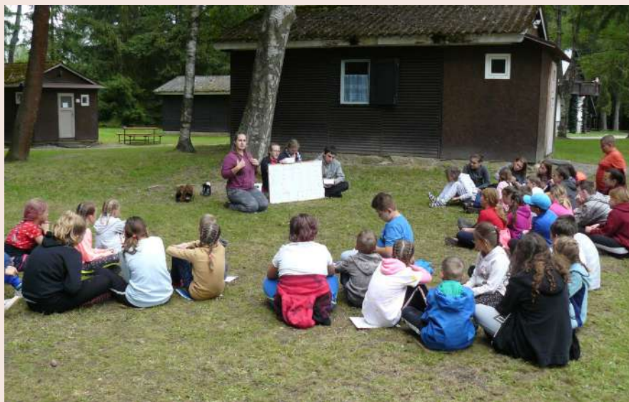
Domeček vás srdečně zve na letní tábory.