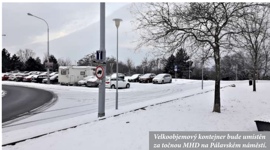
Velkoobjemový kontejner bude umístěn za točnou MHD na Pálavském náměstí.