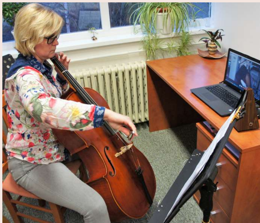
Oslavte se Základní uměleckou školou Den učitelů online od 29. března na kanálu YouTube a na Facebooku. Více v článku na straně 8.