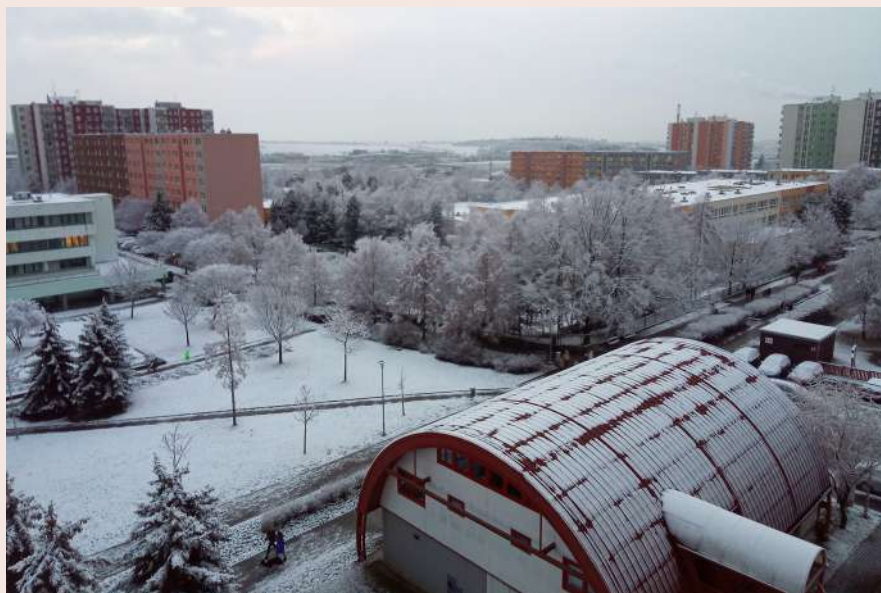
Nádherně zasněžené Vinohrady pro Inform zachytil 7. ledna 2021 Ing. Luděk Hodboď