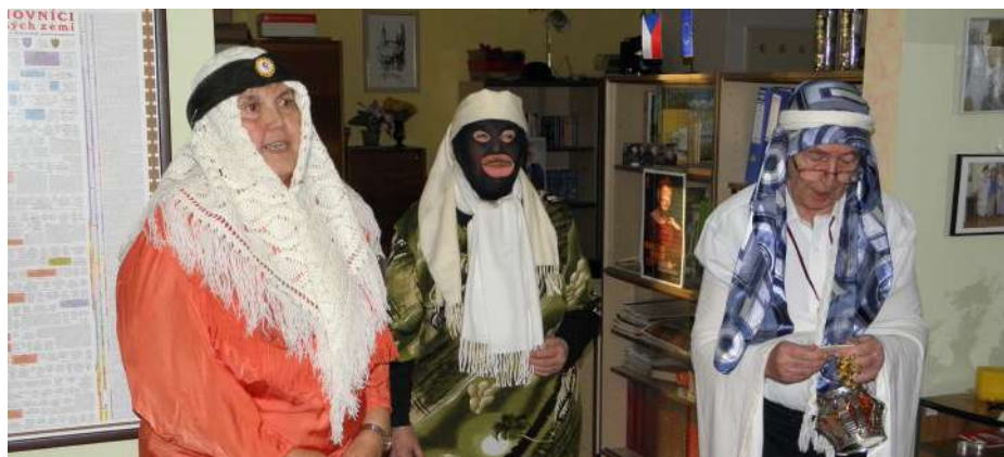
Tři králové v Senior klubu před rokem.