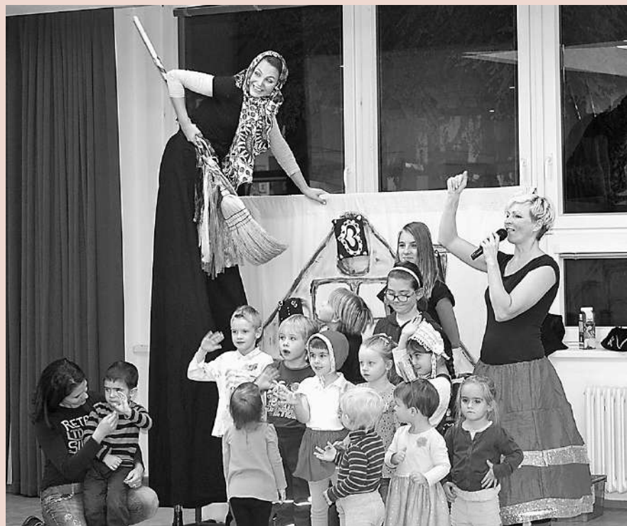
Pohádkový rej s divadlem Kejkle